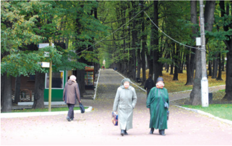
De kastanjelaan in het Lefortovopark vandaag de dag

werd vervolgens geneesheer-directeur van het eerste Russische hospitaal, net buiten de toenmalige stadsmuren aan de Jauza. Daarnaast bouwde Bidloo een eigen zomerhuis van hout en hij ontwierp zelf zijn grote privétuin. Bij latere stadsuitbreidingen is deze 'kleine hermitage' helaas verdwenen. Op de historische plek staat nog wel het militaire ziekenhuis, met daarin een speciaal aan Bidloo gewijde museumzaal.