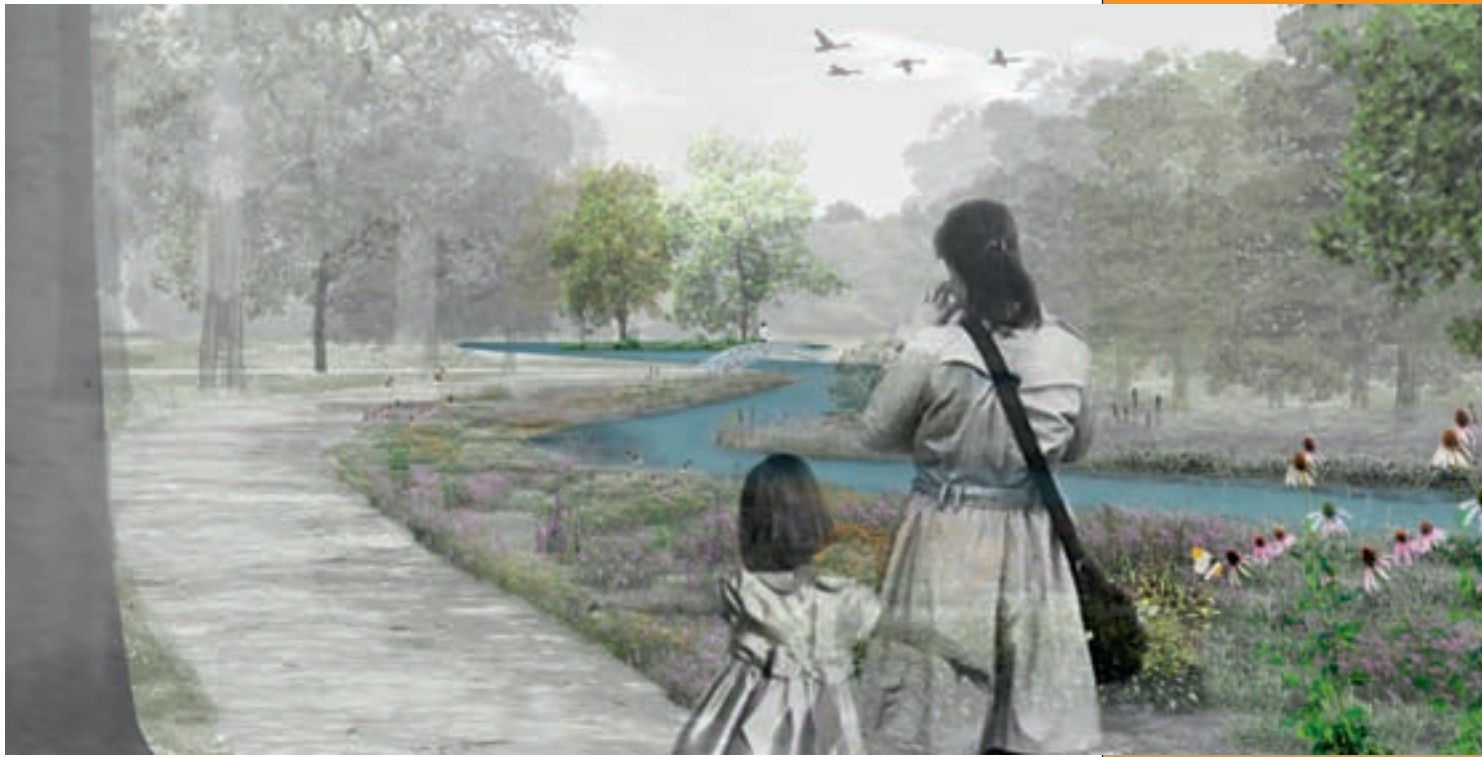
Het urneiland (collage).

fect moest gehandhaafd blijven, eentonigheid van de wandeling moest worden voorkomen.