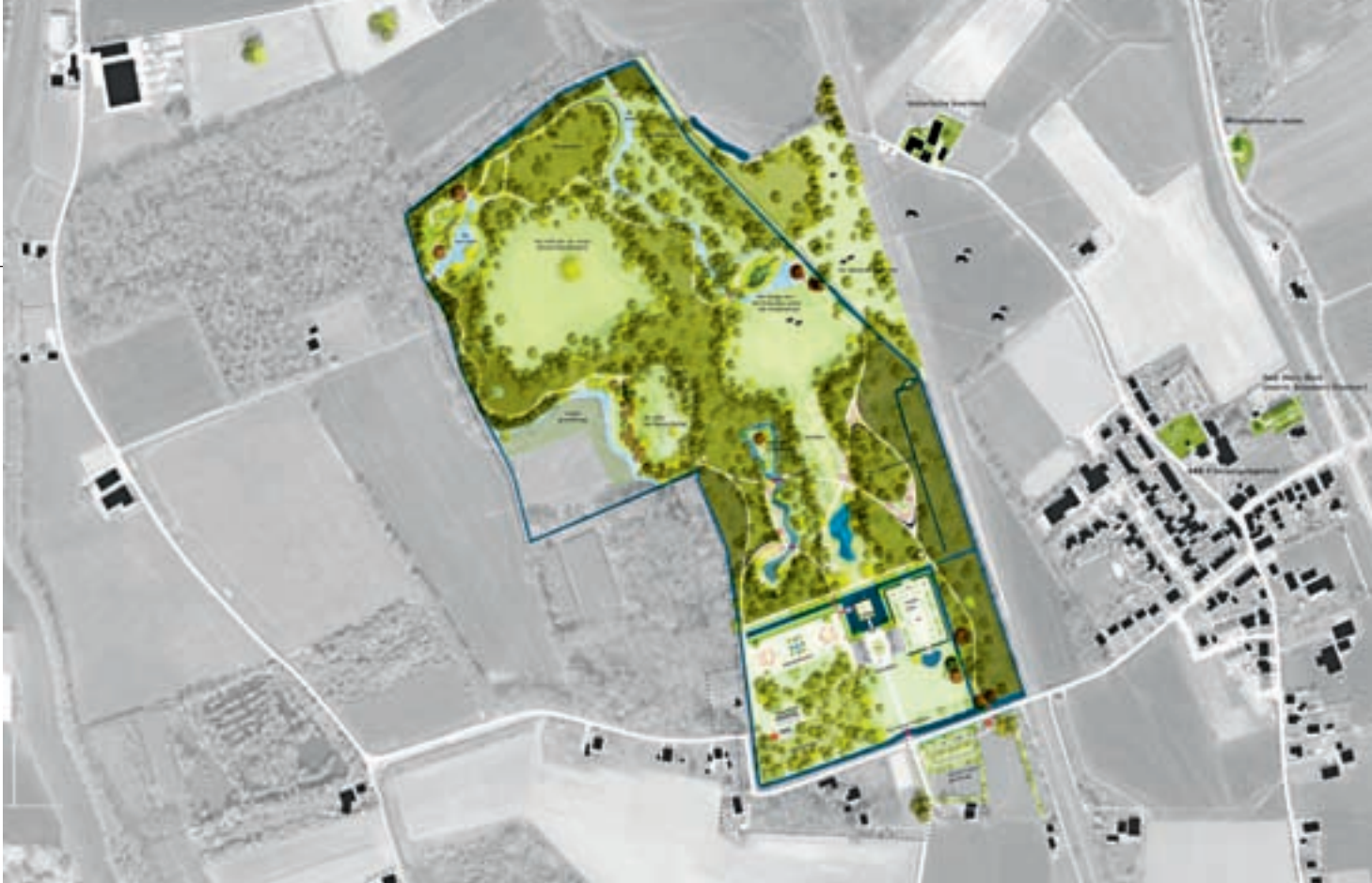
Visiekaart landgoed Windersheim.