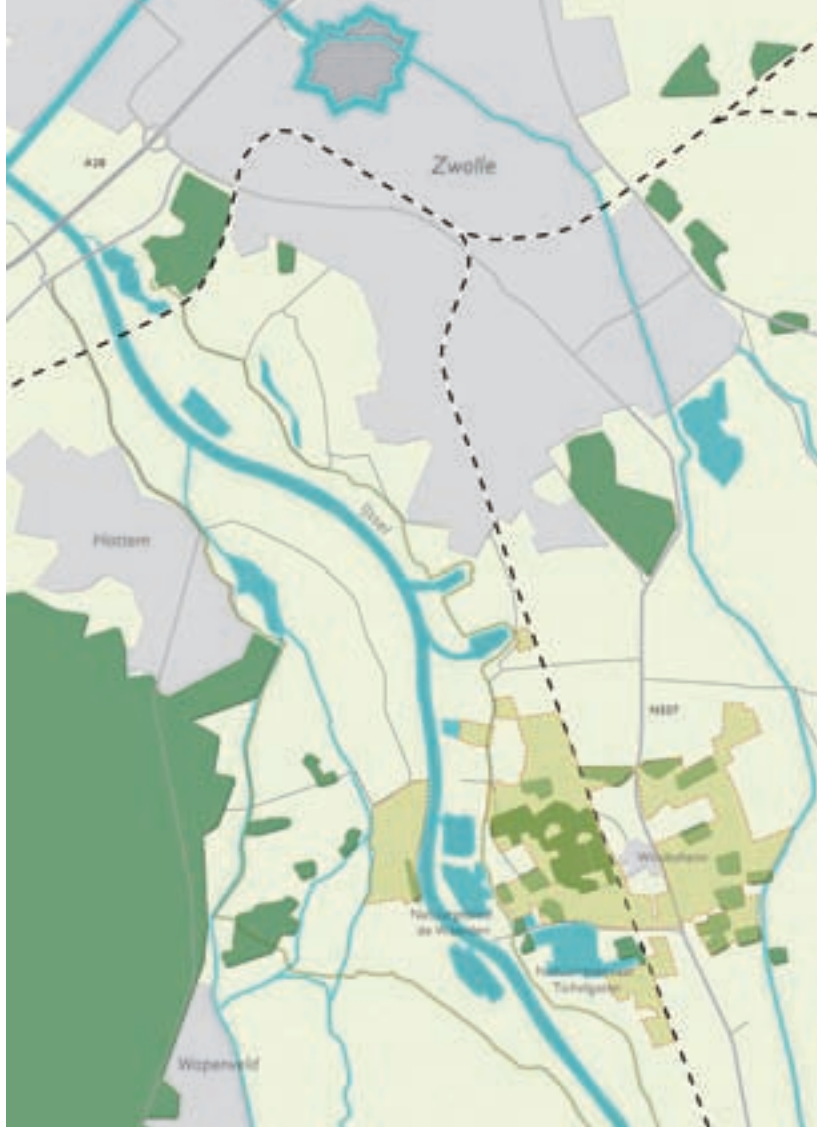
Windesheim in de buurt van Zwolle.

voor de toekomst wordt nagestreefd. De historische buitenplaats vraagt daarbij om bijzondere aandacht. Om Windesheim op korte termijn voor publiek interessanter te maken, wil het bestuur een aantal vernieuwingen en ontwikkelingen doorvoeren, waaronder het terrein toegankelijker en aantrekkelijker maken voor het publiek. Het terrein is nu moeilijk toegankelijk en slecht begaanbaar. Verder wil het bestuur op korte termijn in parkeergelegenheid voorzien voor bezoekers, maar wel passend in een lange termijn visie. Aan H+N+S landschapsarchitecten is daarom gevraagd een lange termijn perspectief te schetsen.