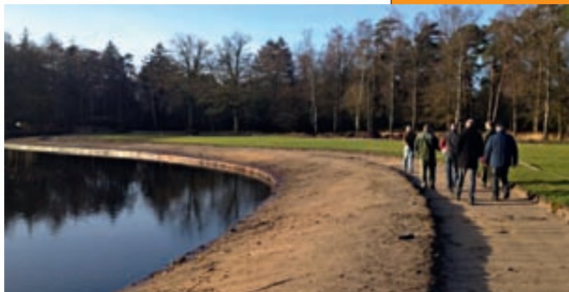
Het park rond het jachtslot St. Hubertus onlangs ook grondig aangepakt, met een krachtig resultaat.

Hoe krachtig het resultaat van een dergelijke aanpak is, kan nu bekeken worden op Landgoed Windesheim, waar de afgelopen winter vele kuubs hout met dit oogmerk zijn gevestigd. Ook bij de parkaanleg van St. Hubertus is deze aanpak gehanteerd. Hier is de afgelopen winter de eerste fase van de vernieuwing gerealiseerd, nadat twee jaar eerder hier al honderden bomen het veld hadden geruimd. Het is de moeite waard om op de beide plekken eens een kijkje te nemen. 2012 is niet voor niets het jaar van de buitenplaats.