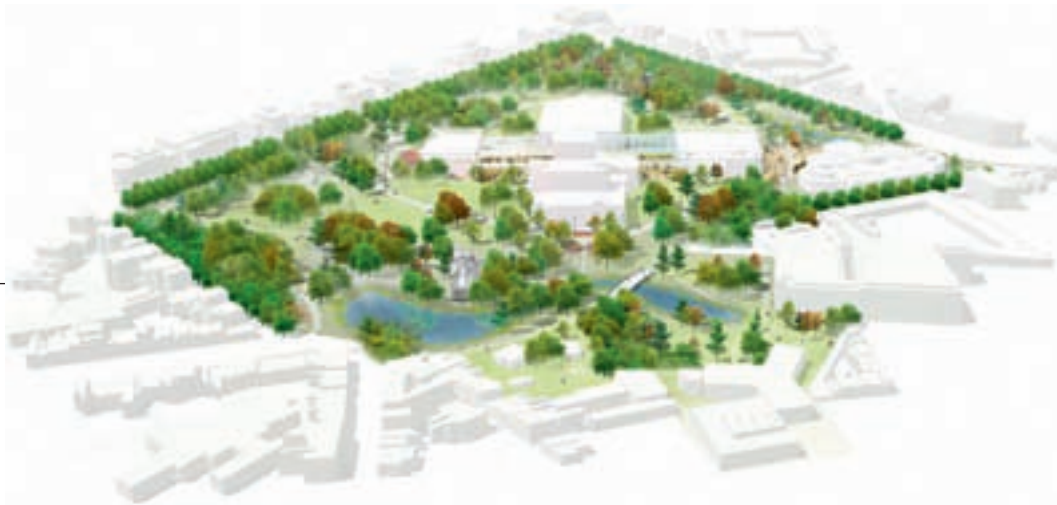
Een impressie in vogelvlucht van plan TV, met op de voorgrond de botanische tuin.

doet aan de traditie als ook aan de nieuwe eisen van gebruik en beheer? En wat is een haalbare interpretatie? Maakt men een beheerplan dat zorgt voor cultuurhistorisch verantwoord beheer en onderhoud, inclusief de aanwezige natuurwaarden, of mag men een park herontwerpen met gebruikmaking van de aanwezige historische waarden?". Het is de spijker op z'n kop. Maar waar De Jong als historicus uitsluitend de fundamentele kwestie weet bloot te leggen, is het natuurlijk aan landschapsonwerpers om deze vraag ontwerpend daadwerkelijk te verkennen.