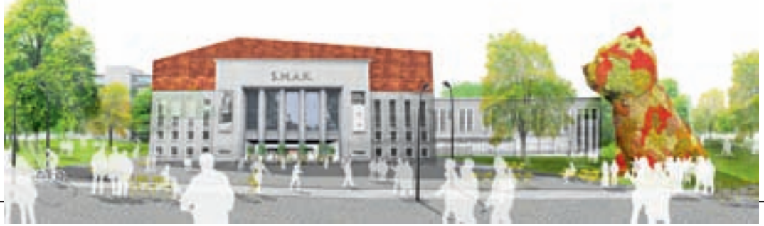
Een collage die weergeeft hoe de situatie bij het Museum voor Schone Kunsten zou kunnen worden.

plan voor de Zwolse buitenplaats Windesheim op mijn tekentafel (zie Vakblad Groen van augustus 2011). In zowel het vernieuwingsplan voor St. Hubertus als bij dat voor Windesheim wordt geprobeerd om de verschillende aanwezige tijdslagen in het plan in te zetten en tot een nieuw evenwicht te sublimeren. Dit vereist een nauwkeurige analyse van wat was, hoe het bedoeld is geweest en wat hiervan in de huidige situatie nog resteert aan sporen. En het vereist een soort 'lenigheid' van de ontwerper, om tegelijkertijd te kunnen ontsnappen aan enerzijds de verleiding tot letterlijk herstel en anderzijds het leggen van te platte verbindingen tussen heel verschillende tijdslagen en om daarbij ook nog in te spelen op de eigentijdse gebruikseisen. Het is ook bij het Gentse Citadelpark onze inzet de aanwezige gelaagde historische ondergrond als uitgangspunt te nemen en op basis daarvan een nieuwe parklaag te ontwerpen die zich respectvol vermengt met de bestaande ondergrond en tegelijkertijd ruimte laat voor nieuwe inzichten van de moderne landschapsarchitectuur en nieuwe functies.